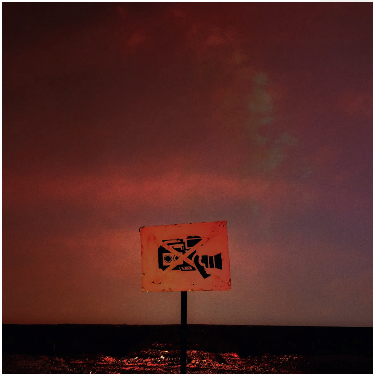
Installation censée interdire l'accès aux zones contaminées.