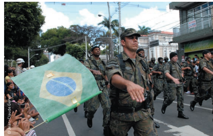
Avec l'éviction du ministre de la Défense et de trois commandants en chef, Jair Bolsonaro veut prendre le contrôle des forces armées.