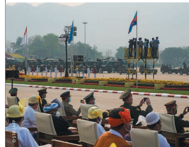
Défilé organisé par les militaires pour souligner la Journée des Forces armées, dans la capitale Naypyidaw le 27 mars 2021.