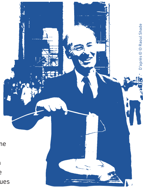
D'après © Raoul Shade

Londres, mai 1961 : douze coups sonnent à Big Ben. C'est l'heure du déjeuner et au White Swan , un élégant pub à deux pas de la Cour de justice, une table de cinq avocats et juristes règle, avec des airs de conspirateurs, les derniers détails d'un Appel qui va faire date. Voilà six mois que cette brochette de trentenaires griffonne, sur des serviettes en papier et dos d'enveloppes, les idées à retenir, les mots qui feront mouche, les contacts à nouer. Insolites documents qui, des années plus tard, seront le trésor des archives du secrétariat londonien d'Amnesty International. Dans l'immédiat, ces « plans sur la comète » vont s'entasser dans le bureau, tout proche du pub, de Peter Benenson, l'initiateur d'une belle utopie : lancer, par un appel à une société civile qui alors n'existe pas, une campagne mondiale pour la libération des prisonniers politiques. Une idée qu'il cultive depuis la lecture, en novembre 1960, dans le métro d'une brève relatant l'arrestation de deux étudiants portugais ayant trinqué à la liberté, geste subversif sous la dictature de Salazar. Voilà longtemps que Peter Benenson, homme de gauche et catholique convaincu, s'est engagé pour la liberté. En tant qu'avocat, il l'a défendue sur le terrain en Espagne, en Afrique du Sud,