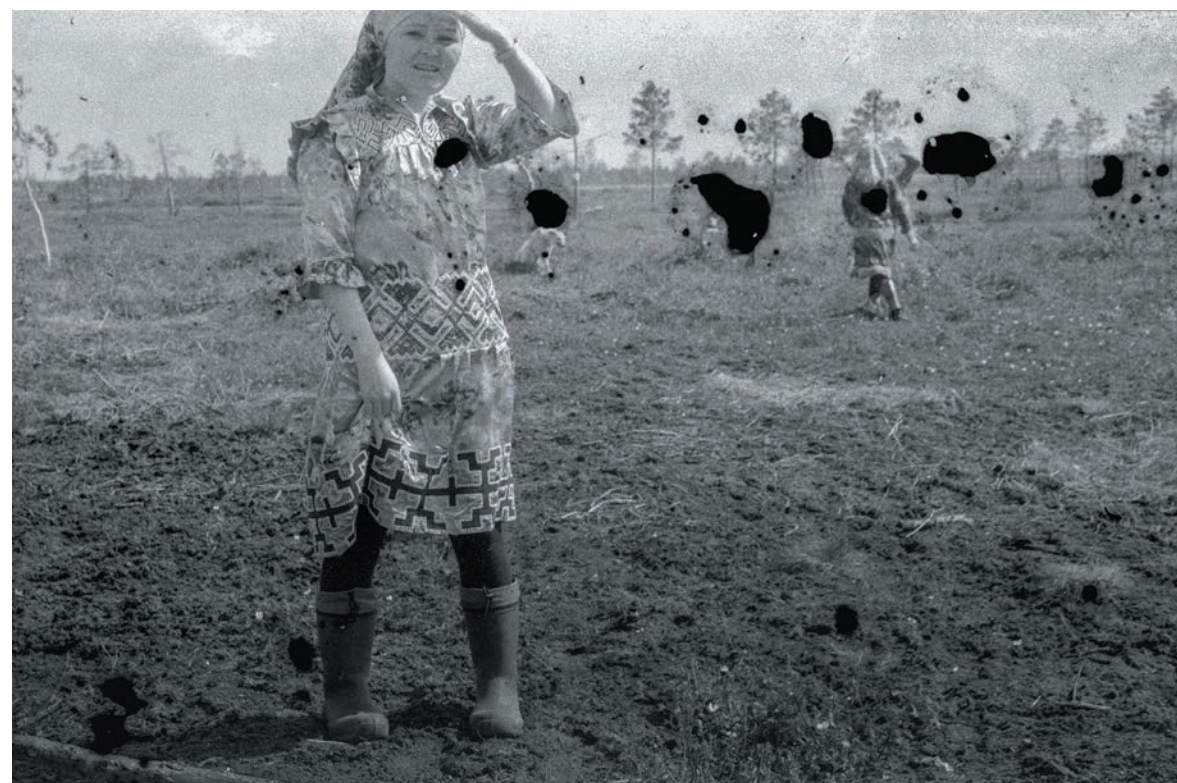
© IGOR TERESHKOV. Projet « Oil and moss »