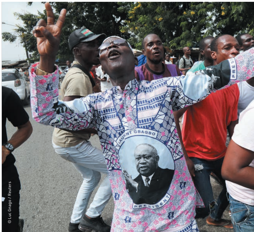
Manifestations de joie des partisans de Laurent Gbagbo après son acquittement définitif, à Abidjan, le 31 mars 2021.