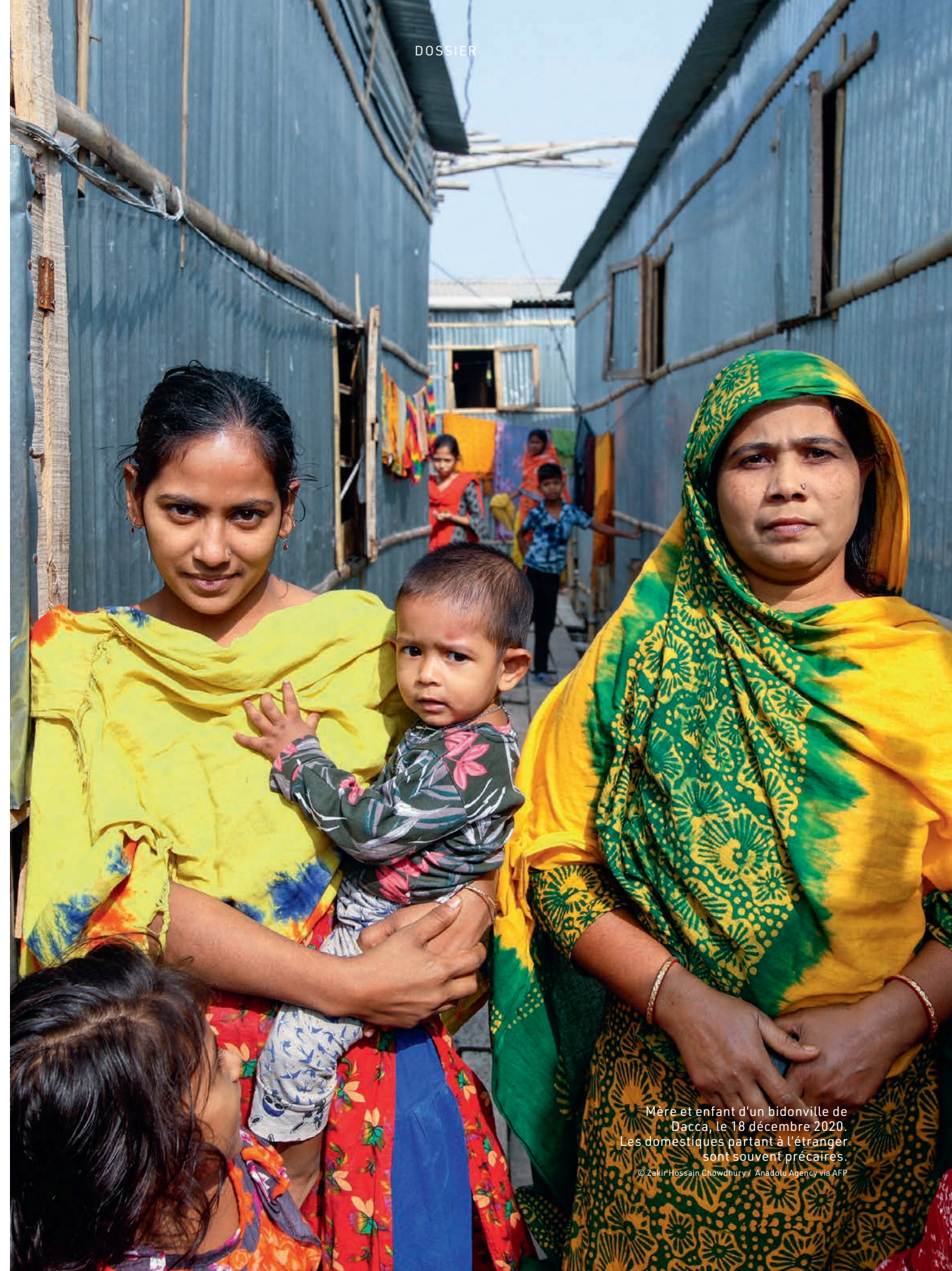
Mère et enfant d'un bidonville de Dacca, le 18 décembre 2020. Les domestiques partant à l'étranger sont souvent précaires.

Qatar: Reality Check 2020: Countdown to the 2022 World Cup - Migrant Workers' Rights, novembre 2020, disponible sur amnesty.fr