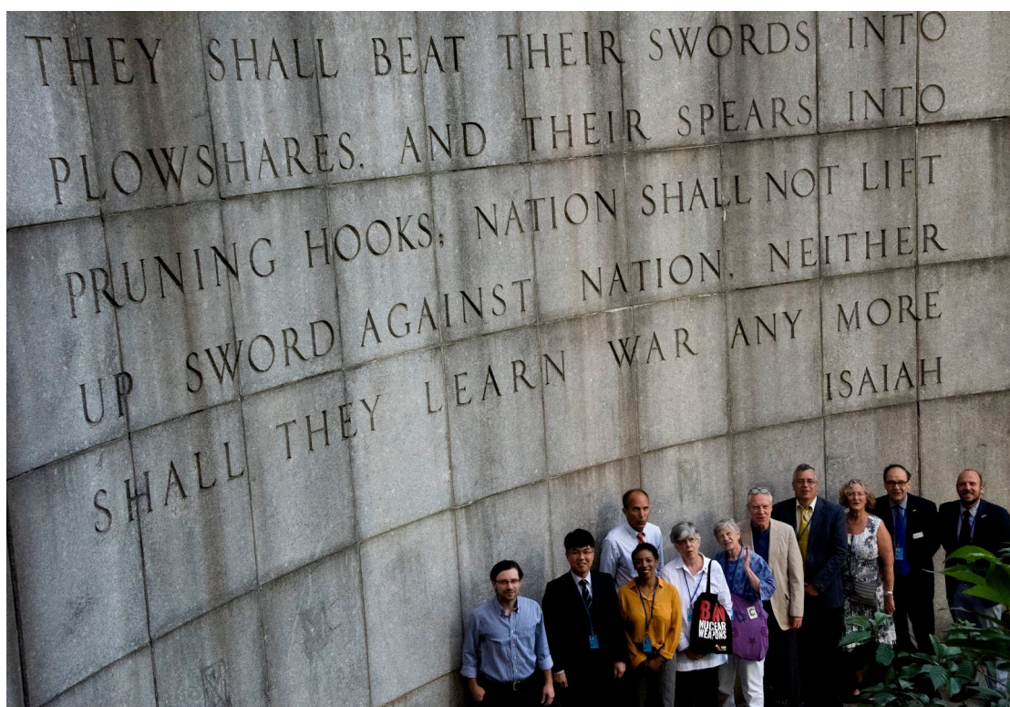
Militants d'ICAN de toutes confessions devant le mur d'Isaïe, près du siège des Nations Unies à New York, avant l'adoption du TIAN en juillet 2017.

Les membres de l'Église catholique sont depuis longtemps à l'avant-garde du mouvement d'opposition contre les armes nucléaires et de promotion pour le désarmement, y compris le mouvement Plowshares , partisan engagé contre la guerre.