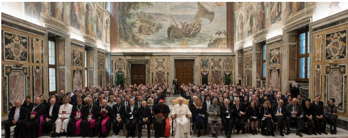
Pape François au symposium international pour le désarmement nucléaire organisé par le Vatican en novembre 2017, avec la participation des lauréats du Prix Nobel de la Paix, y compris ICAN.

Le Pape a également condamné le gaspillage de « précieuses ressources » dans une « course aux armements » continue, demandant instamment aux dirigeants de réfléchir aux moyens qui permettent de gérer les ressources mondiales en vue de la « complexe et difficile application » de l'Agenda 2030 pour le Développement Durable. Il a ajouté : « dans le monde d'aujourd'hui, où des millions d'enfants et de familles vivent dans des conditions inhumaines, l'argent dépensé et les fortunes gagnées dans la fabrication, la modernisation, l'entretien et la vente d'armes toujours plus destructrices sont un outrage continu qui crie vers le ciel. »