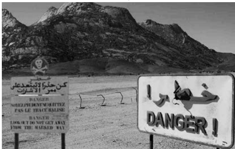
Pour une réhabilitation des sites des essais nucléaires français dans le désert algérien

«Le conseil d'administration se réunit, sur convocation de son président, en session ordinaire, quatre fois par an. Il peut se réunir en session extraordinaire lorsque l'intérêt de l'agence l'exige, sur convocation de son président, sur proposition des deux tiers de ses membres ou sur proposition du directeur général», précise l'article 13. Enfin, le directeur général de l'agence est nommé, «conformément à la réglementation en vigueur, sur proposition du ministre chargé de